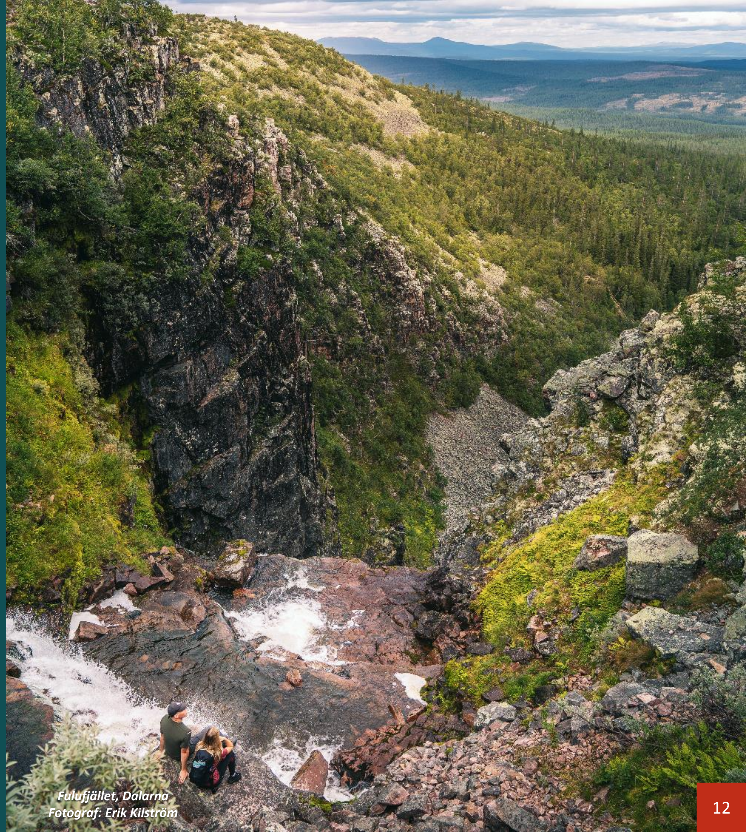
Fulufjället, Dalarna

Sakförsäkring som primärt syftar till att ersätta markägare vid skogsbrand samt ansvarsförsäkring som skyddar markägare mot skadeståndsanspråk ska finnas. Försäkring för skötselutförare ska finnas. Vem som ansvarar för försäkringar ska framgå i ansvarsfördelningen.