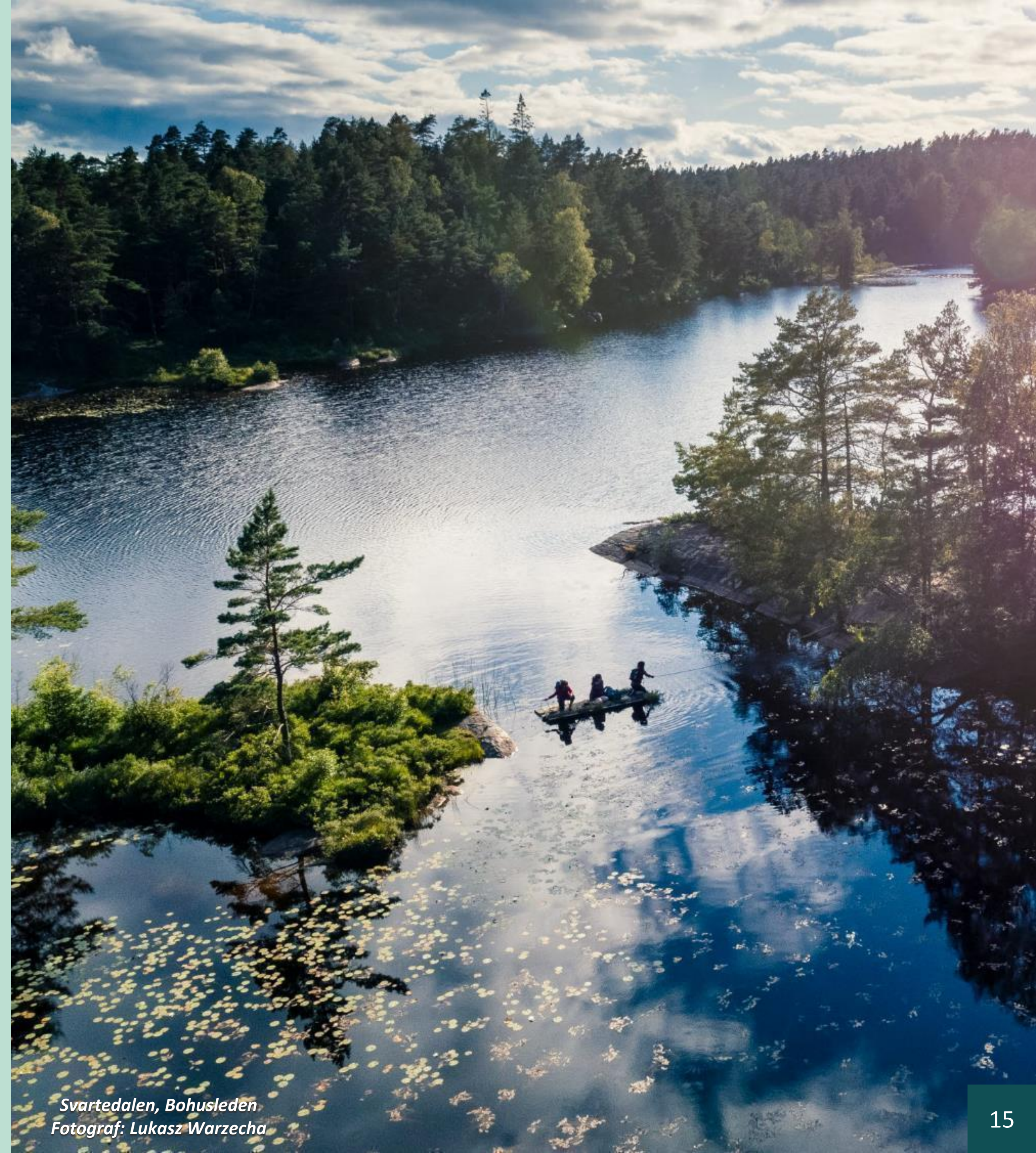
Svartedalen, Bohusleden

En led får gärna ha ett utvecklat tema som lyfter fram områdets historia eller erbjuder besökarna andra värden. I dessa fall kan det finnas ytterligare tematiska ska-krav att förhålla sig till, t.ex. kan Pilgrimsleder ha krav på historisk koppling och platser för andliga upplevelser längs leden.